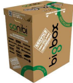
BIGBOX 150 litres 70 cm X 60cm X 40cm