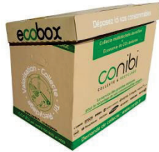
ECOBX 100 litres 45 cm X 60 cm X 40 cm

Dès la première collecte (*), nous vous livrons des contenants adaptés pour regrouper vos consommables usagés :